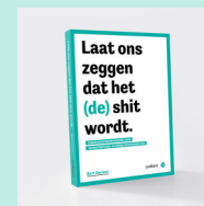
Ce modèle stratégique est tiré du livre 'Laat ons zeggen dat het (de) shit wordt' de Bart Derison.

Qu'il s'agisse d'un courrier aux riverains, d'un marché de l'information ou d'une publication Facebook, les trois dimensions de ce modèle permettent de vérifier à chaque instant si votre communication est bien équilibrée. Ce dont vous pouvez vous assurer en contrôlant l'importance des mots et des images pour chacun des trois W ou par leur ordre. Cela change donc avec le temps. Un courrier aux riverains concernant un projet peut ainsi avoir trois aspects différents à trois moments différents tout en étant pourtant exactement le même.